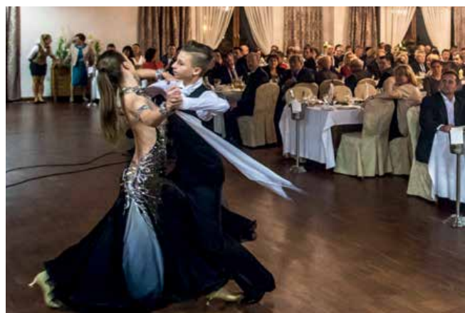
Pokaz tancerzy ze Sportowego Klubu Tańca „Start”.