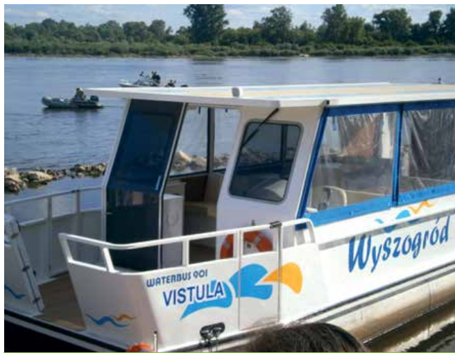
Tramwaj Vistula.

Przy Nabrzeżu Wiślanym i na rzece znów można zobaczyć tramwaj wodny Vistula.