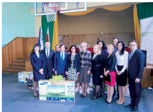
■ Szczęśliwcy odbierają nagrody w loterii „Szczęśliwa Lokata Bis”.