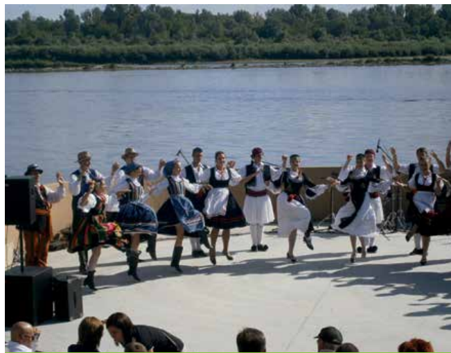
Występ zespołu folklorystycznego Radost.