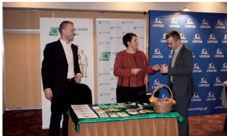
Stoisko Vistula Banku Spółdzielczego w hotelu Sofitel Victoria.

Vistula Bank Spółdzielczy uczestniczył w Zgromadzeniu Ogólnym Cooperatives Europe, Międzynarodowego Związku Spółdzielczego, które odbyło się w warszawskim hotelu Sofitel Victoria w dniach 2–4 kwietnia br. Na specjalnie przygotowanym stoisku Bank zaprezentował swoją ofertę oraz przedstawił profil swojej działalności jako przykład właściwej pracy spółdzielczej organizacji. Cooperatives Europe jest zrzeszeniem reprezentującym 95 organizacji członkowskich z 35 krajów naszego kontynentu. Zajmuje się wspieraniem działań na rzecz równych szans dla spółdzielni i innych form przedsiębiorczości. Dlatego zrzeszenie stara się wpływać na europejską politykę, tak by spółdzielczość była w niej dostrzegana i doceniana.