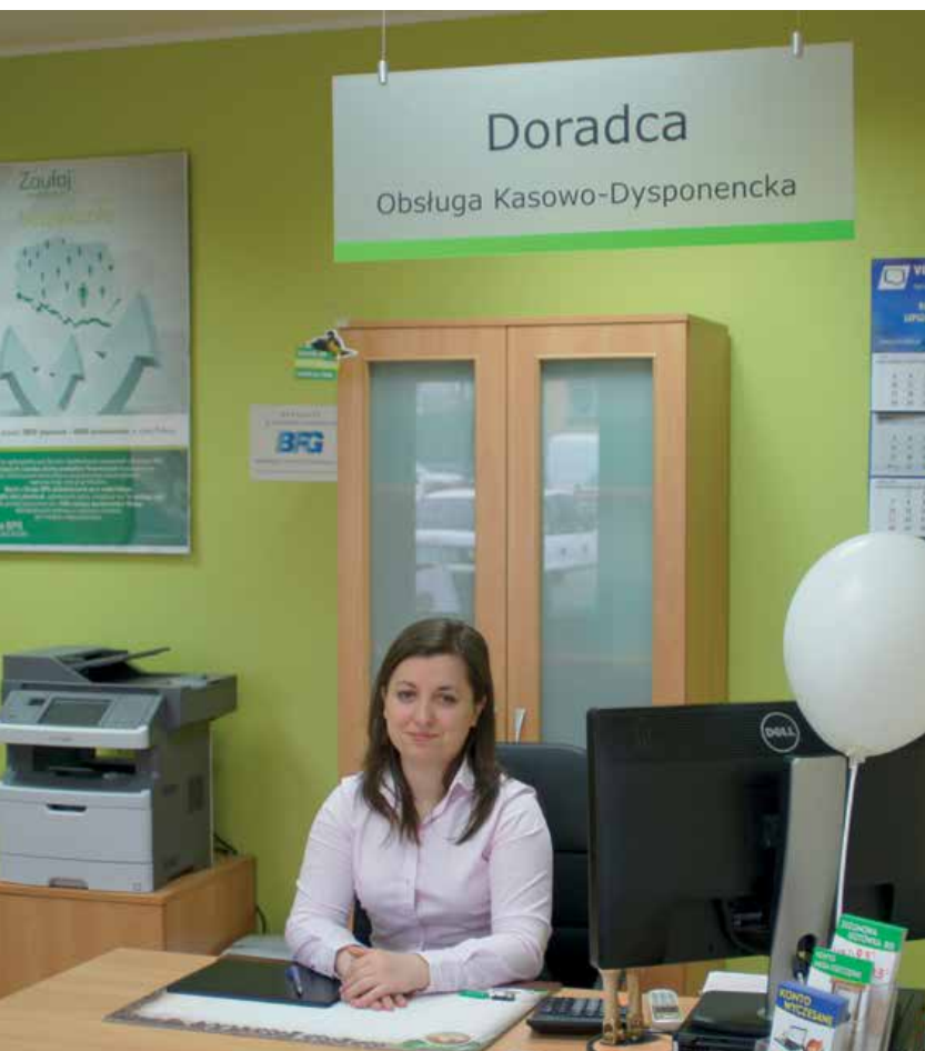
Stanowisko obsługi klienta w Filii w Wisłtiskach Vistula Banku Spółdzielczego.