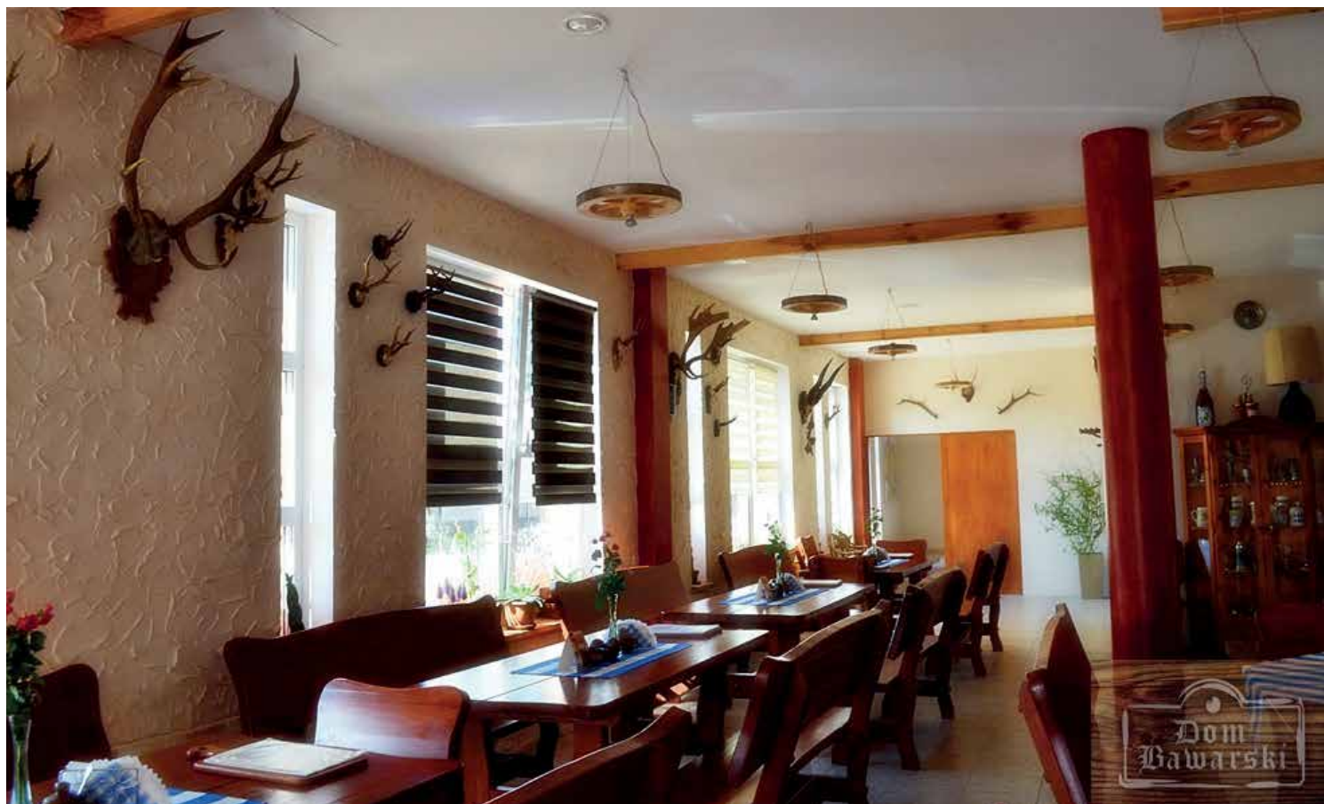
Wnętrze restauracji Dom Bawarski.

” Obiekt bardzo szybko wrósł w otoczenie i stał się miejscem spotkań mieszkańców oraz kierowców, którzy tędy podróżują